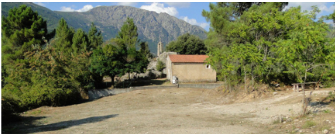
Chapelle St Antoine de nos jours

La ruine du bâtiment fut ensuite une longue agonie. Il n'en reste plus aucune trace autour de la chapelle qui, elle, est toujours solide.