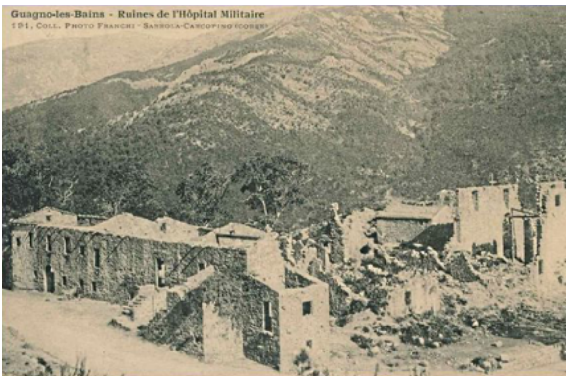
Ruines de l'hôpital militaire au début du XX e siècle

et incommodo faite à Guagno le 13 février 1822, le préfet de la Corse avait autorisé cette aliénation le 28 février 1822" (François Van Cappel de Prémont, Guagno-les-Bains à travers la petite histoire du thermalisme).